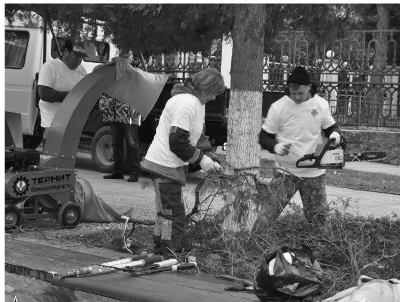
▲ Волонтеры организации «Люди дела» освобождают курорт от мусора

И все это бодро, с настроением! За очередными акциями и субботниками на благо курорта следите по публикациям в Instagram-аккаунте организации.