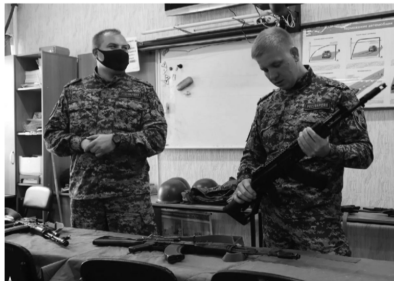
▲ Разборка и сборка автомата АК-74

«Соревнования для молодежи – это всегда зазор, упорство и состязательность, – отметили специалисты управления по де-