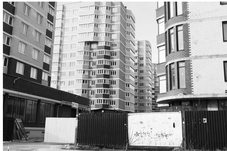
Жилой комплекс «Лазурный» включает 442 квартиры