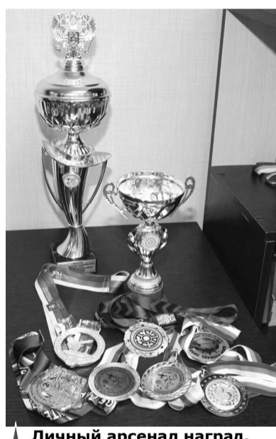
Личный арсенал наград, завоеванных за 4 года