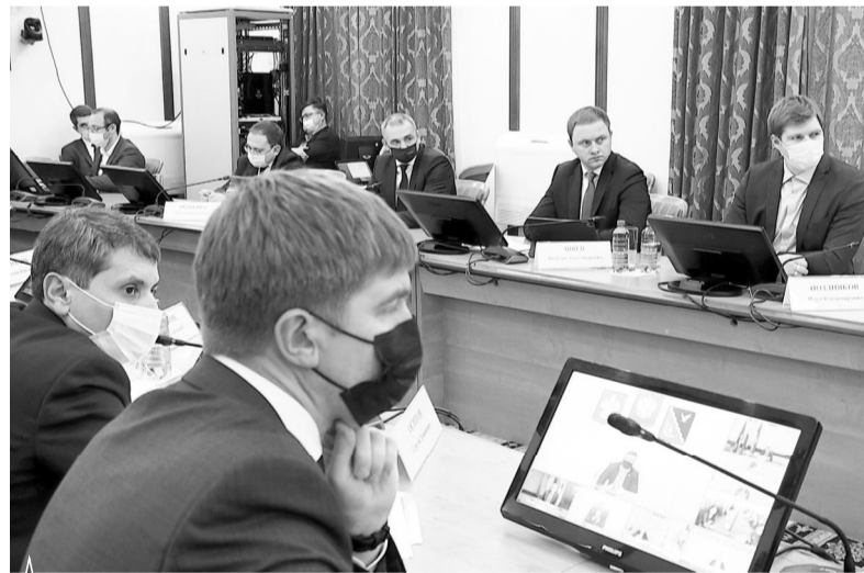
На совещании в краевом центре

Восстановлены права участников долевого строительства 36 объектов