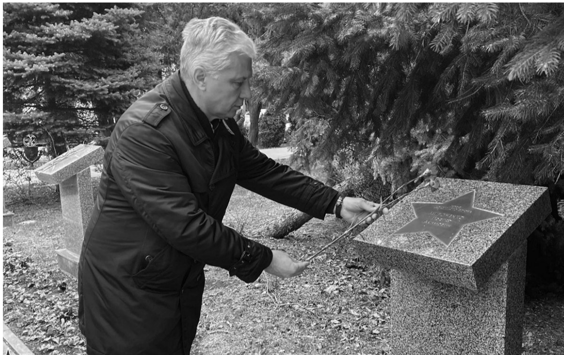
▲ Алые гвоздики в знак благодарности за подвиги — к звездам на «Аллее героев»