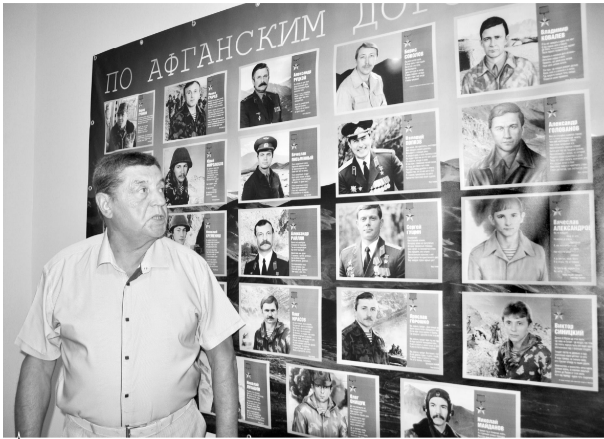
В офисе организации – стенд героев войны в Афганистане

– Начинали свою деятельность с 17 членов организации. На сегодня нас 35 человек, и ряды организации постепенно растут. Костяк