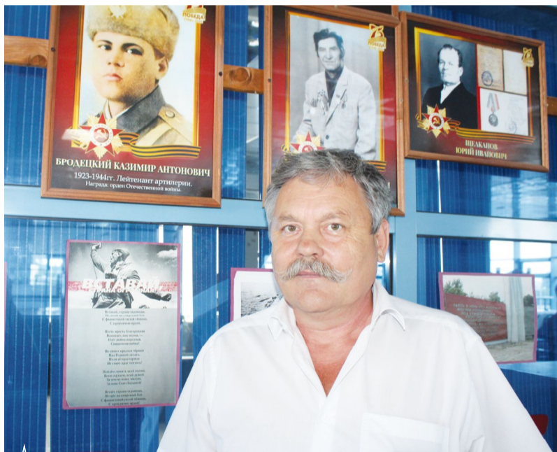
▲ Юбиляр у портрета родного дяди