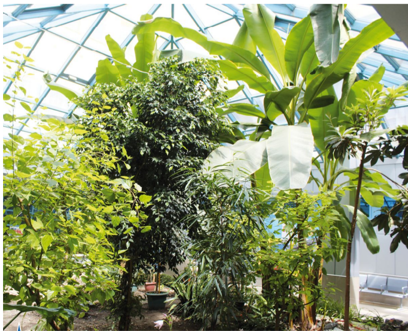
▲ В зимнем саду всегда лето!