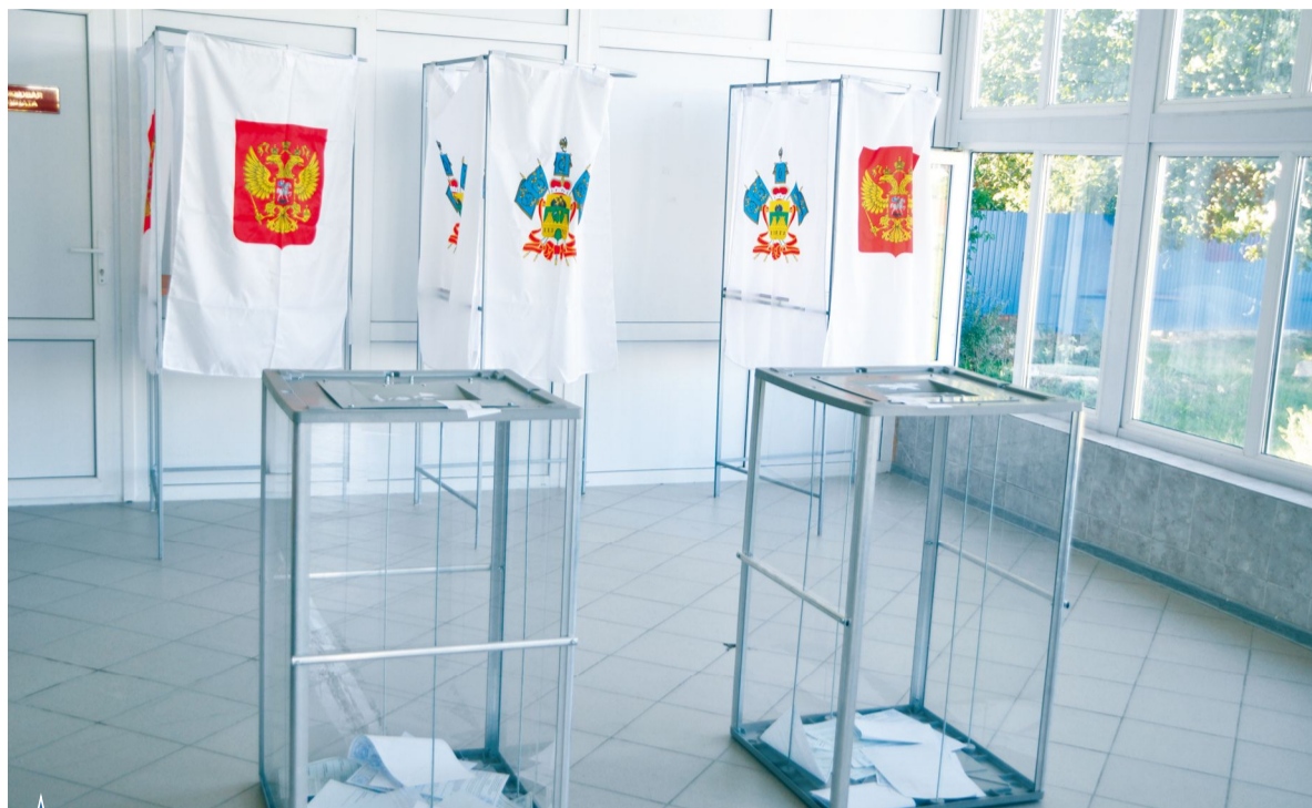
ЦИК официально объявил о проведении трёхдневного голосования – с 17 по 19 сентября

В сентябре 2021 года в стране пройдут выборы в Государственную Думу Российской Федерации. Как и в прошлом году, когда мы голосовали за поправки в Конституцию РФ, они будут проходить в течение трех дней – с 17 по 19 сентября. Мы решили поговорить на эту тему с самыми разными людьми и выяснить, как анапчане относятся к трёхдневному формату голосования.