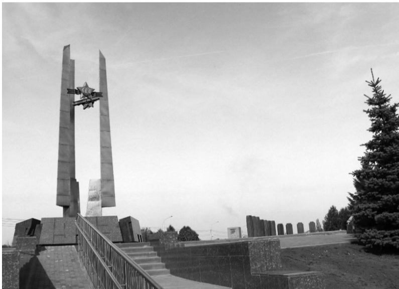
Мемориальный комплекс на площади Победы в Ельце