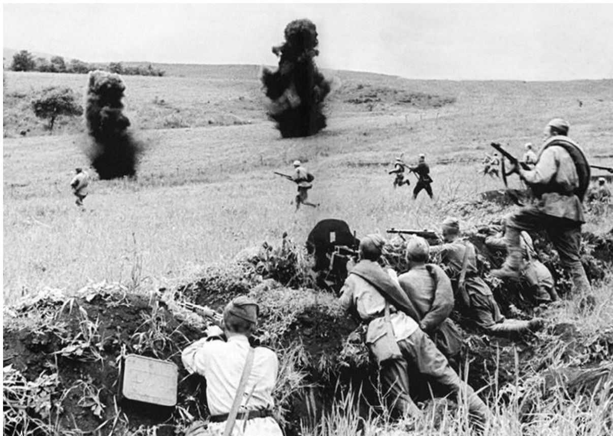
Атака советской пехоты. Кубань, июнь 1943-го

Спустя несколько дней под хутором Красная Балка молодой сержант и бойцы его отделения первыми ворвались в хутор и в