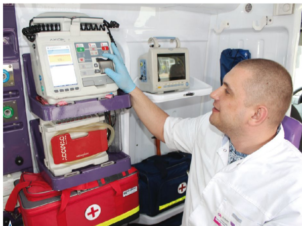
▲ Автомобиль оснащён всем необходимым для оказания экстренной помощи