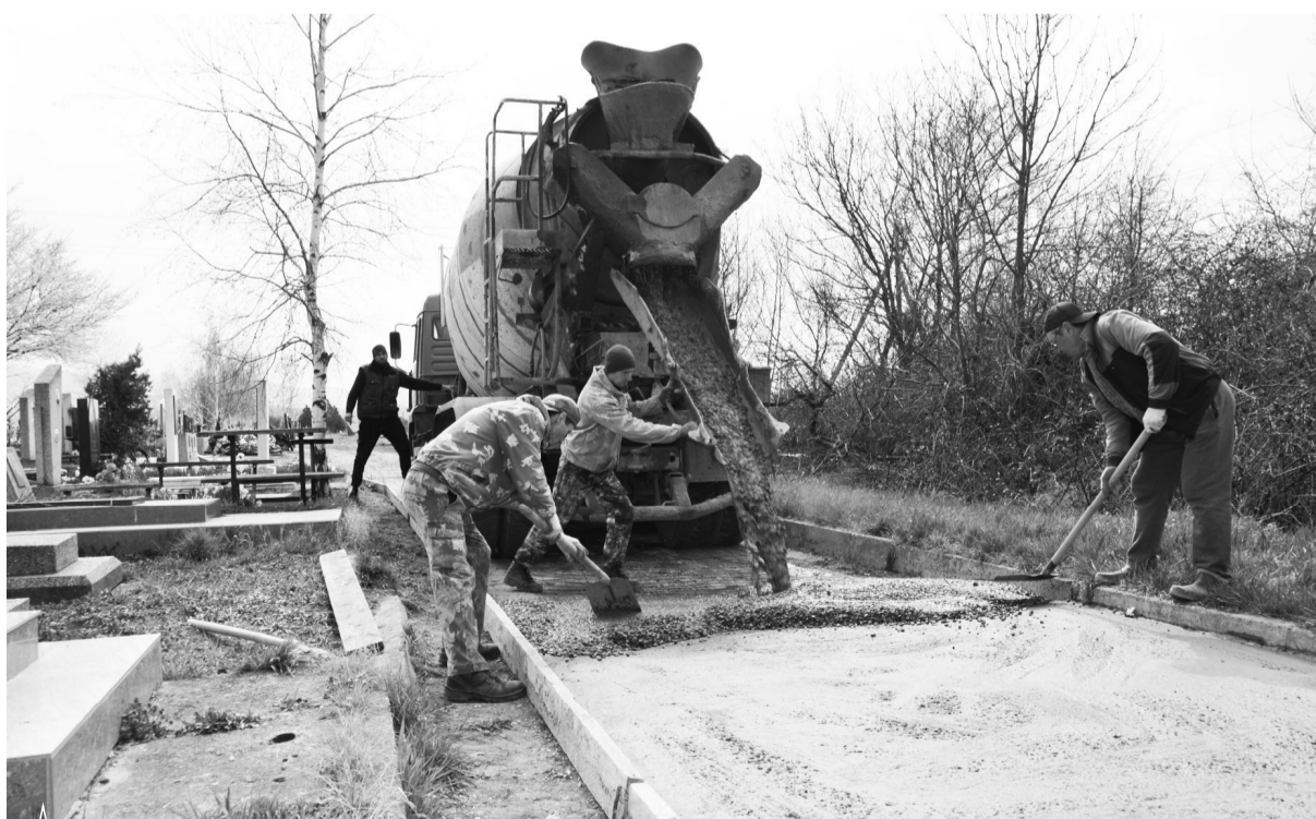
▲ Обустроено более 200 метров новых бетонных дорожек и установлены бордюры

Кроме того, было установлено два новых стационарных туалета, один из которых находится в отдаленном секторе кладбища. Также был разработан проект и проложено более пятисот метров водопроводной трубы, которую в дальнейшем подключат к системе водоснабжения.