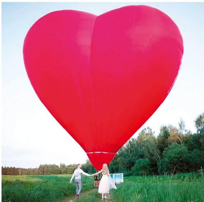
▲ Желающие смогут устроить в небе регистрацию бракосочетания и сделать самый необычный фотосет

ные туры – экскурсии на местные винодельни, а рестораны Анапы предложат коллекцию российских вин. Впервые состоится межконтин-