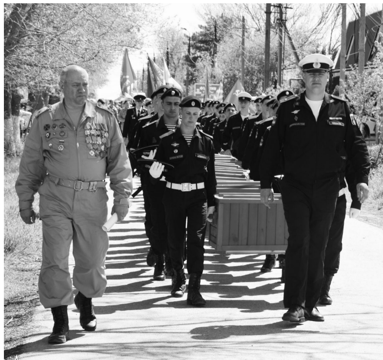
Останки советских бойцов в водах Кизилташского лимана обнаружили участники поискового отряда «Вымпел»