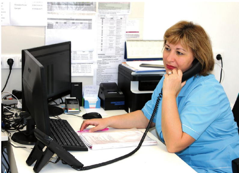
▲ «Диспетчерская слушает!»