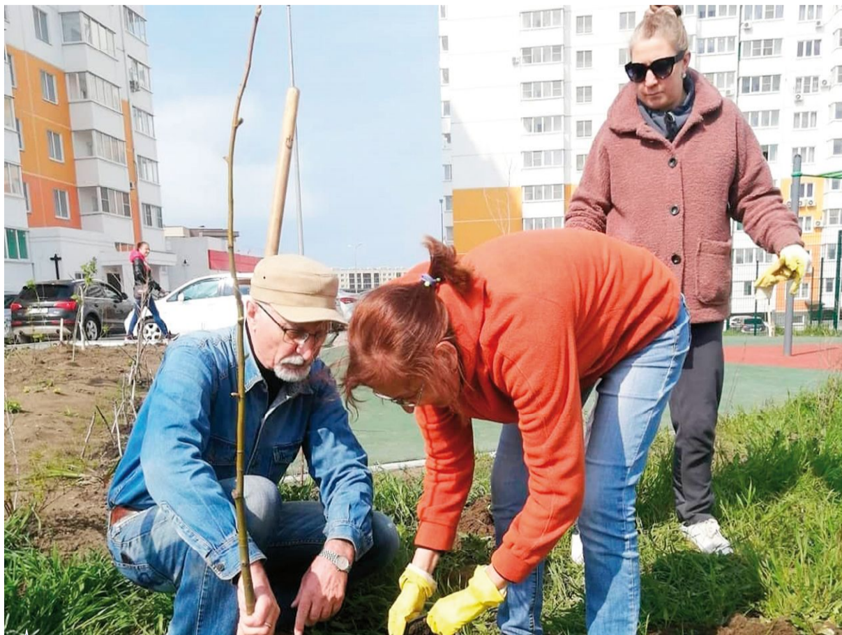
▲ Жители провели благоустройство территории и высадили молодые деревца липы