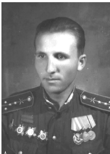
▲ В одном из сражений он уничтожил три таких 75-миллиметровых орудия немцев