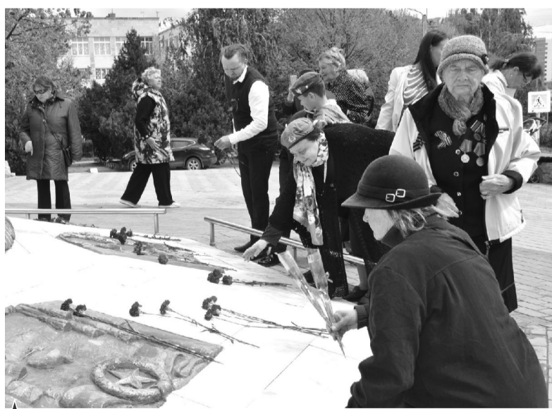
Анапчане возложили цветы к монументу «Три свечи»