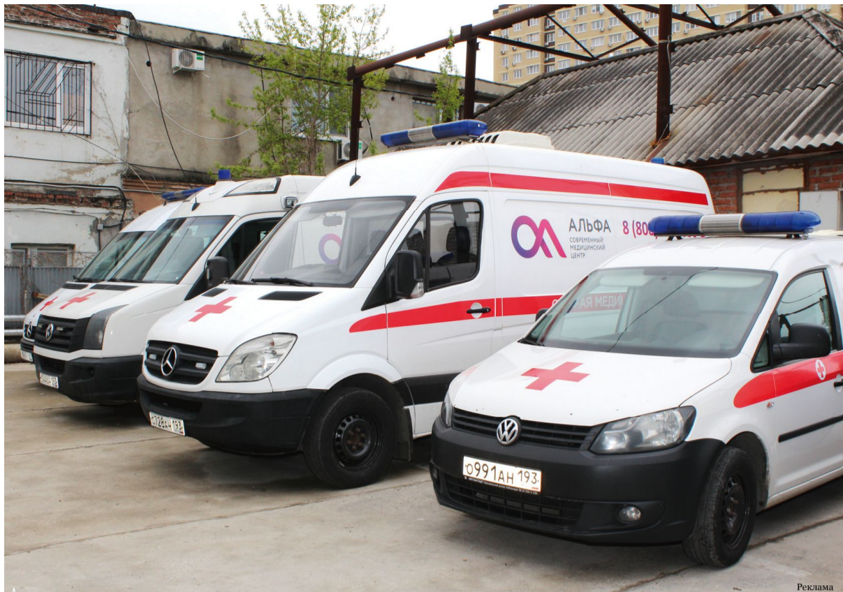
▲ Сегодня автопарк «Альфы» насчитывает 8 карет «неотложки»

– За это время мы неоднократно оказывали помощь пациентам на дому. Если была необходимость,